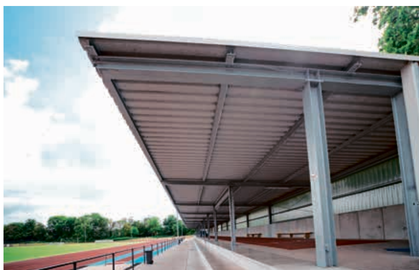
Das Sportzentrum für Leichtathletik (Ludwig-Wolker-Sportanlage) mit dem überdachten Leichtathletik-Bereich.