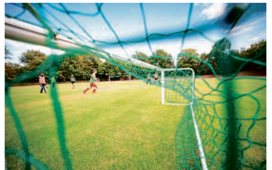
Das Von-Waldthausen Stadion in Norf erhielt einen Kunstrasenplatz.

Win-Win Situation: Mehr Möglichkeiten durch Absprachen und eine bessere Vernetzung, Sharing von Kompetenzen und Know-How und bedarfsgerechtere Anpassung an sich verändernde Bedürfnisse. Alle von der Stadt beschlossenen Maßnahmen dienen hier dem Ziel, auch in Zukunft allen Neussern ein allumfassendes, die unterschiedlichsten Bedürfnisse berücksichtigendes, sportliches Angebot machen zu können und für ein sportlich anregendes Umfeld zu sorgen.