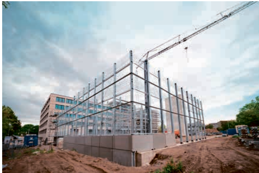
Die Baustelle für den Neubau der Creditreform kommt gut voran.

Nach wie vor verzeichnet Neuss wachsende Einwohner- und sozialversicherungspflichtig Beschäftigtenzahlen in mehr als 5.000 Unternehmen. Zu den größten Stärken der Neusser Wirtschaft zählt neben der hohen Anzahl an Unternehmen auch die Vielschichtigkeit der Unternehmerschaft. So finden sich Unternehmer der verschiedensten Branchen und Betriebsgrößen in den Gewerbegebieten und Stadtteilen. Von Einzelunternehmern über zahlreiche mittelständische Betriebe bis hin zu global agierenden Konzernen leisten alle Unternehmen einen Beitrag zu dem erfolgreichen Wirtschaftsstandort. Eines dieser erfolgreichen Unternehmen ist die große Wirtschaftsauskunftei Creditreform, deren Hauptsitz sich seit 1947 in Neuss befindet. Bisher verteilt auf mehrere Standorte im Büroпарк Hammfeld. Das soll sich Ende 2020 ändern, wenn die neue Firmenzentrale „Crefo Campus Neuss“ an der Ecke Hammfelddamm/Stresemannallee bezogen wird. Noch befindet sich das imposante Bürogebäude im Bau. Bauherr und Investor ist die Hamburger Quantum Immobilien AG, die auf dem repräsentativen „Turmgrundstück“ bis Ende des Jahres ein sechsgeschossiges, modernes Bürogebäude mit insgesamt 14.000 Quadratmetern Geschossfläche errichten wird. Hinzu kommt ein Parkhaus mit 425 Autostell-