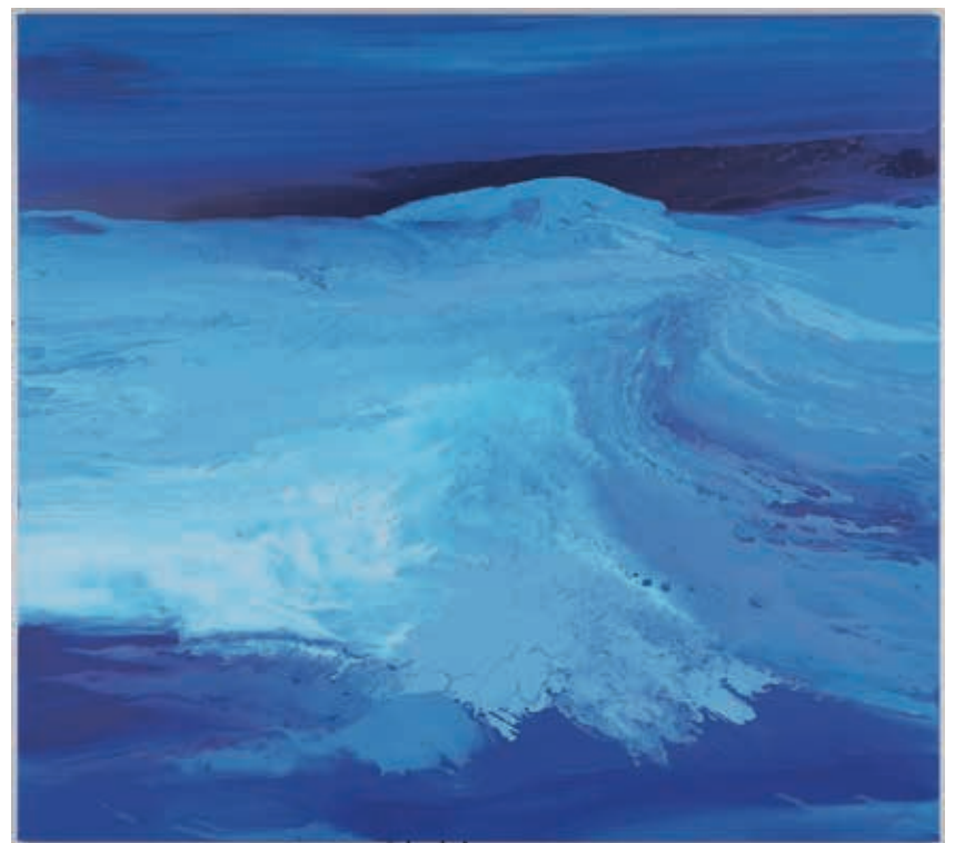
Oscillare, o.T. von Melanie Richter. Acryl auf Canvas.

bestehen, besichtigt werden. Zudem wurde ein Aufruf zur Abgabe eines Kunstwerks für ein gemeinsames „Logo“ gestartet. Die Ausschreibung wurde an Kunstschulen und -akademien veröffentlicht, sowie an junge heranwachsende Künstlerinnen und Künstler aus den jeweiligen Städten übermittelt. Das Sinnbild soll Themen wie Freundschaft, Zusammengehörigkeit, Aufbruch, Zukunft und Toleranz verdeutlichen. Die eingesandten Beiträge werden nun ab dem 22. Juni 2020 im Kulturforum Alte Post präsentiert. Eine Fachjury wird die Werke begutachten und die drei besten Entwürfe der jeweiligen Partnerstadt erhalten eine Siegerprämie.