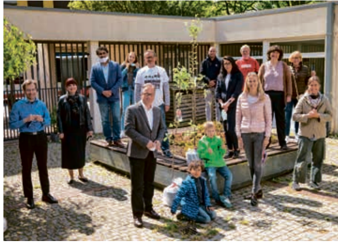
Auch dem „Gnadentaler Gabentisch“ wurde mit einem Apfelbäumchen gedankt.