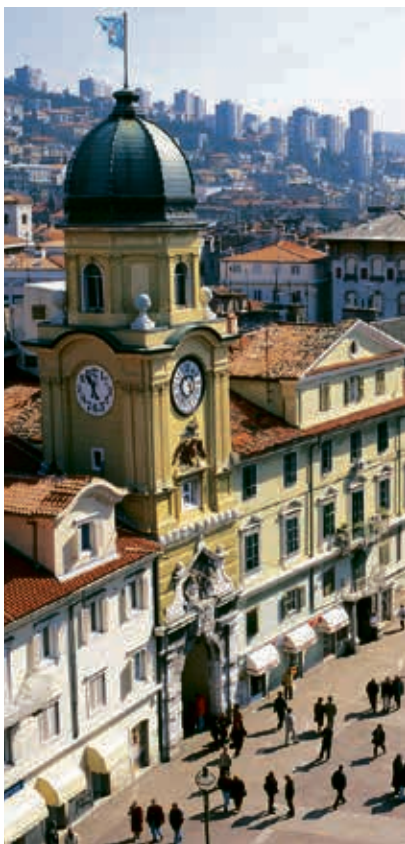
Der Stadtturm von Rijeka.