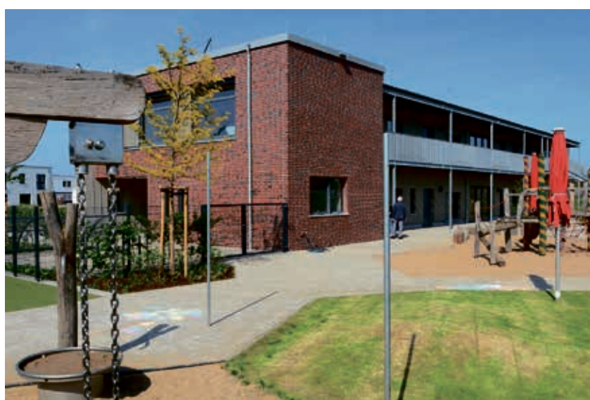
Eins der abgeschlossenen Projekte: Die Kita Wimmelgarten in Holzheim.

Auch in diesem Jahr gibt es für das Gebäudemanagement Neuss eine Reihe größerer Projekte. Im Bereich der Kita-Neubauten zur Deckung des U3-Bedarfs sind – wie jedes Jahr – drei in Planung und