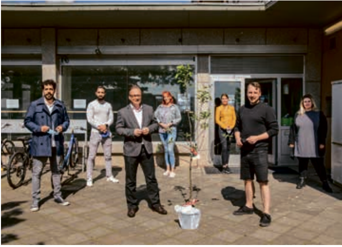
Die erste Station der Dankestour war die Offene Tür im Barbarviertel.