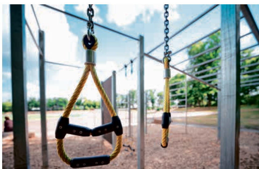
Im Jahnstadion entstand eine moderne Callanetics-Anlage mit Informationssystem.