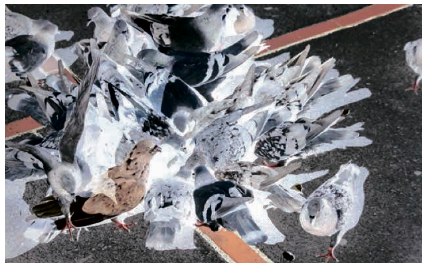
Delta #4 von Stefanie Minzenmay.