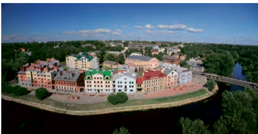
Blick auf die Stadt Pskow.

Das dieses Jubiläum mit Pskow im April dieses Jahr in Neuss gefeiert werden sollte, ist in Anbetracht historischer Geschehnisse alles andere als selbstverständlich. Für Pskow begann 1941 eine dreijährige Leidenszeit unter der deutschen Wehrmacht, der SS und dem SD. Nach der Befreiung der Stadt durch die sowjetische Armee lebten von einst 60.000 Einwohnern nur noch wenige in der Stadt. Als sich das Kriegsende abzeichnete und die Deutschen ihren Rückzug einleiteten, legten sie Pskow in Schutt und Asche. Kraftwerk, Kirchen, Kliniken, Schulen, Geschäfte, Schienen – alles wurde gesprengt. Lediglich einige wenige Häuser blieben stehen. Geschehnisse, die das Verhältnis zu den Deutschen über die folgenden Jahrzehnte langfristig störte.