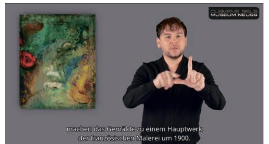
Videostill aus dem Gebärdensprachvideo produziert von Skarabee Partnerschaft im Auftrag des Clemens Sels Museums Neuss. Werk: Odilon Redon, „Der Wagen des Apoll“, um 1905.

Auszug aus einer Bild-Beschreibung in Leichter Sprache von der Webseite des Museums.