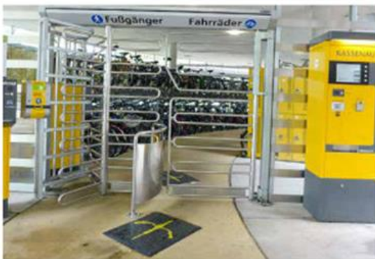
Drehkreuzanlage in Freiburg