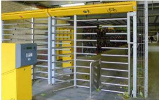
Drehkreuzanlage in Karlsruhe

Außerdem kann die ordnungsgemäße Nutzung nachträglich kontrolliert werden. Selbst in Radstationen ohne Zugang für die Nutzer wird Videoüberwachung zur Abwehr von Betrugsversuchen durch die Kunden genutzt. Elektronische Zugangssysteme können einfach protokollieren, wer zu welcher Zeit den Eingang zur Sammelschließanlage oder Fahrradstation geöffnet hat, und im Falle einer weiteren Ausgangskontrolle auch die Aufenthaltszeit. Damit ist ein guter Überblick über das Nutzerverhalten möglich.