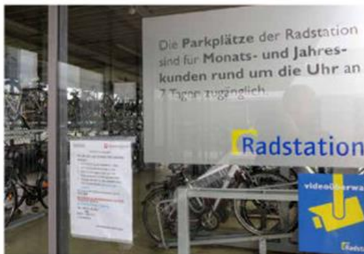
Hinweis zur Videoüberwachung