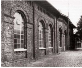
La salle des machines (salle de pompage) de l'usine de distribution d'eau de l'Est, 1981