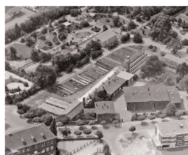
Vue aérienne de l'usine de distribution d'eau dans la Weingartstrasse avec salle des machines (dr.) et maison du contremaitre (ga.) ainsi que le jardin botanique, 1964