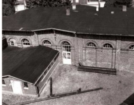
Le hall en brique à sept axes de la station de pompage peu avant l'arrêt, vers 1985