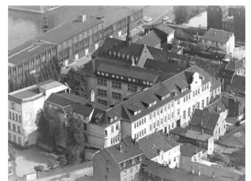
Vue sur l'ancien bâtiment scolaire avant la destruction, 1965.

Le canal de l'Erft avec la Cathédrale de St. Quirin et la Chapelle Marienberg, vue de nord-est, carte postale vers 1905