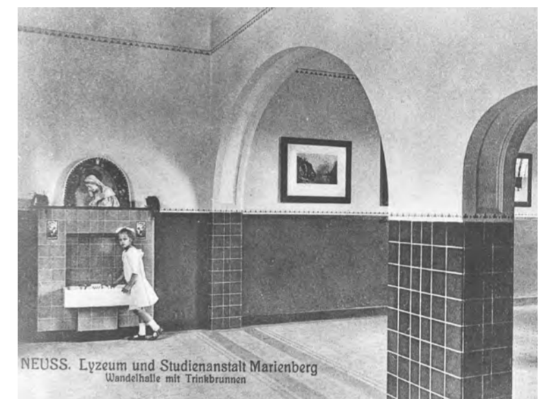
Salle des pas perdus avec fontaines, carte postale vers 1920