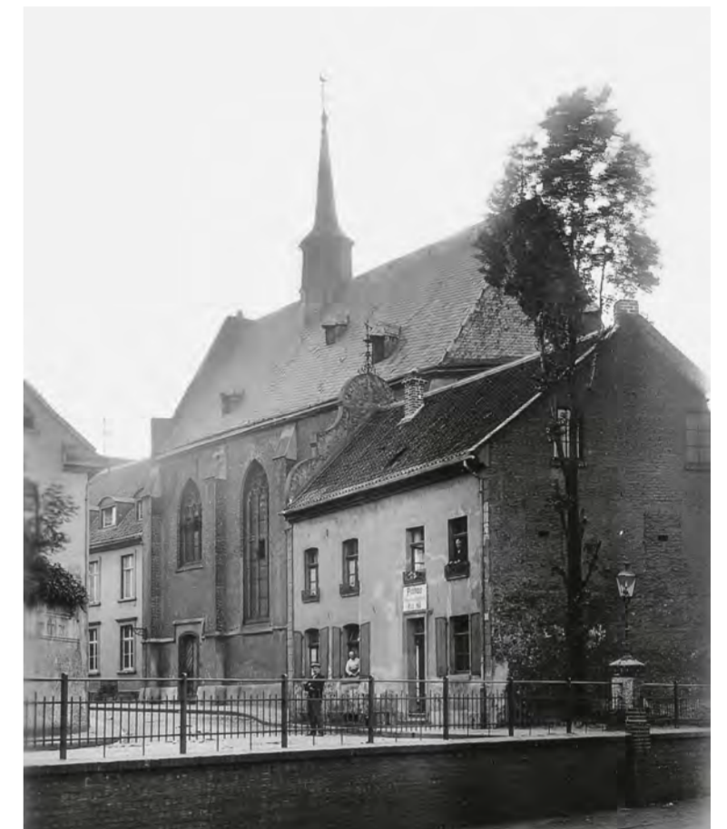
La chapelle de Marienberg au Glockhammer, vers 1900.