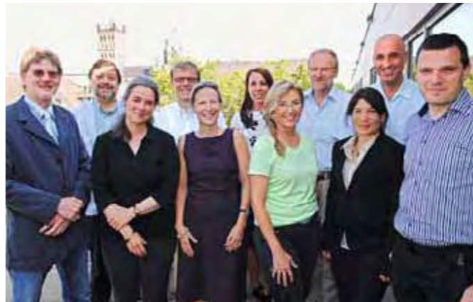
Das Team der Volkshochschule Neuss freut sich auf Sie.

Und zusätzlich nach vorheriger Terminvereinbarung.